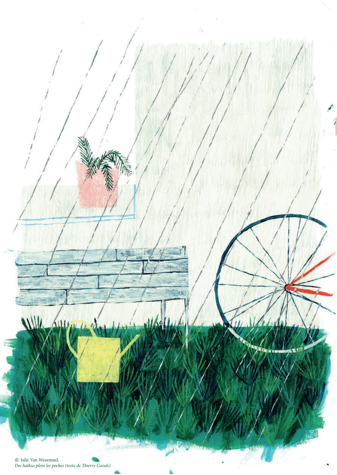
ill. Julie Van Wezemael, Des haïkus plein les poches (texte de Thierry Cazals)